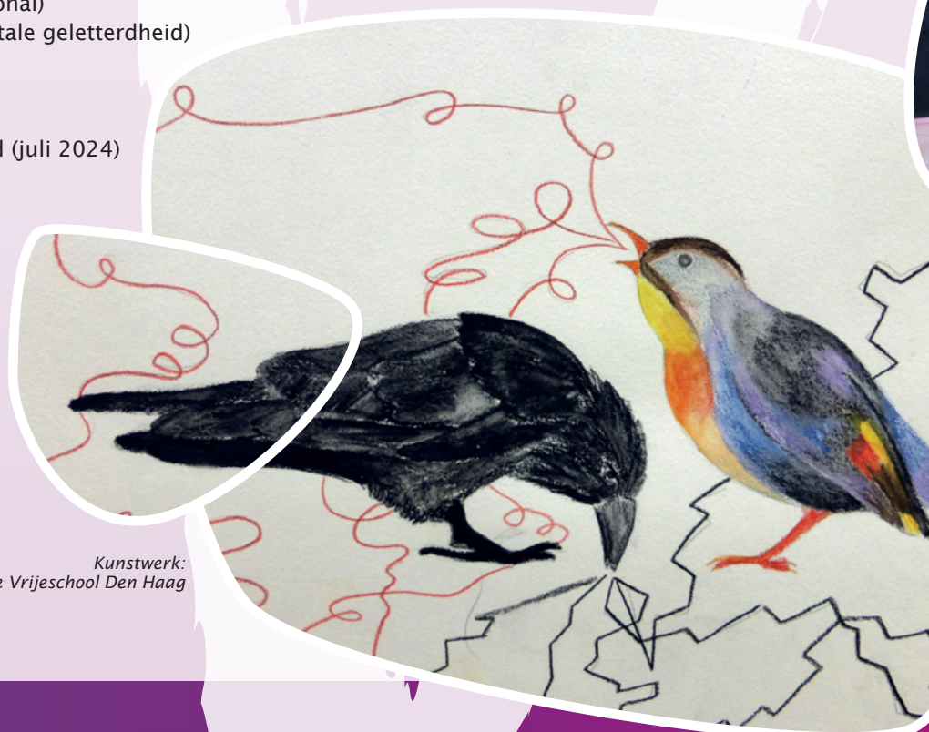
Kunstwerk: leerling - De Vrijeschool Den Haag