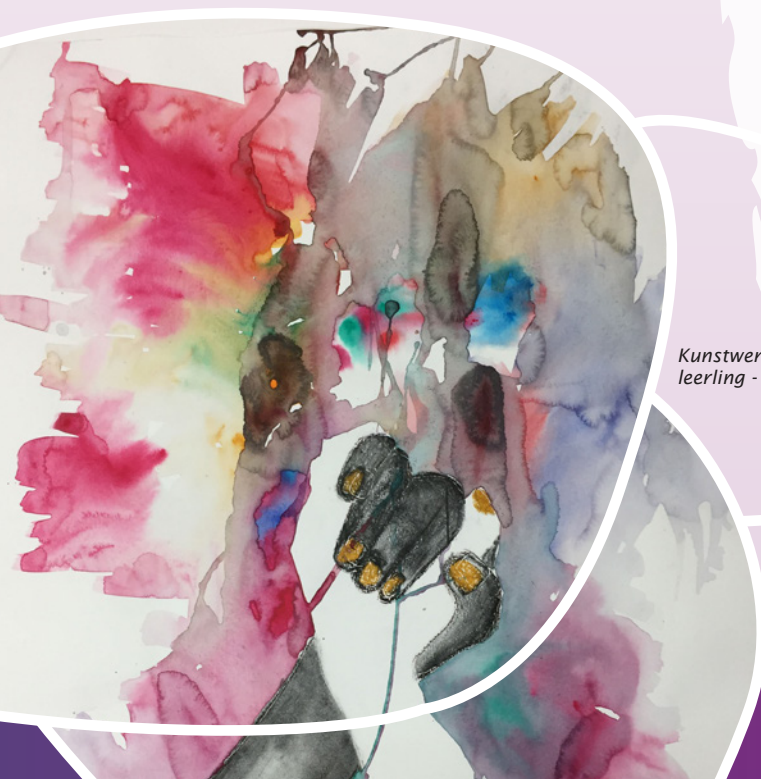
Kunstwerk: leerling - De Vrijeschool Den Haag