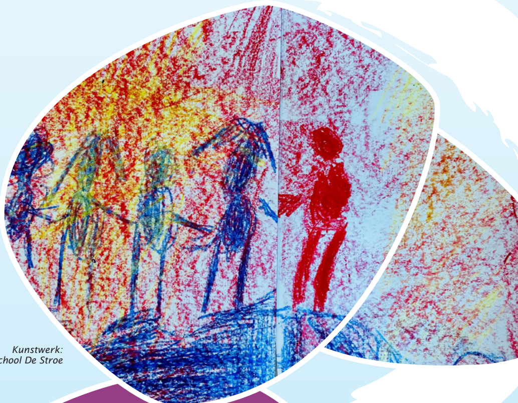
Kunstwerk: leerling - Vrije School De Stroef