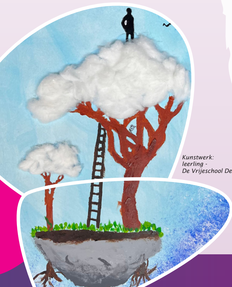
Kunstwerk: leerling - De Vrijeschool Den Haag