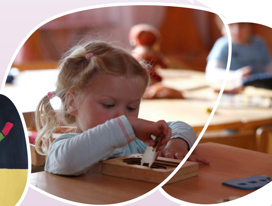
Kunstwerk: leerling - De Vrije School Den Haag