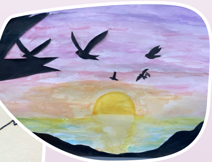
Kunstwerk: leerling - Karel de Grote college