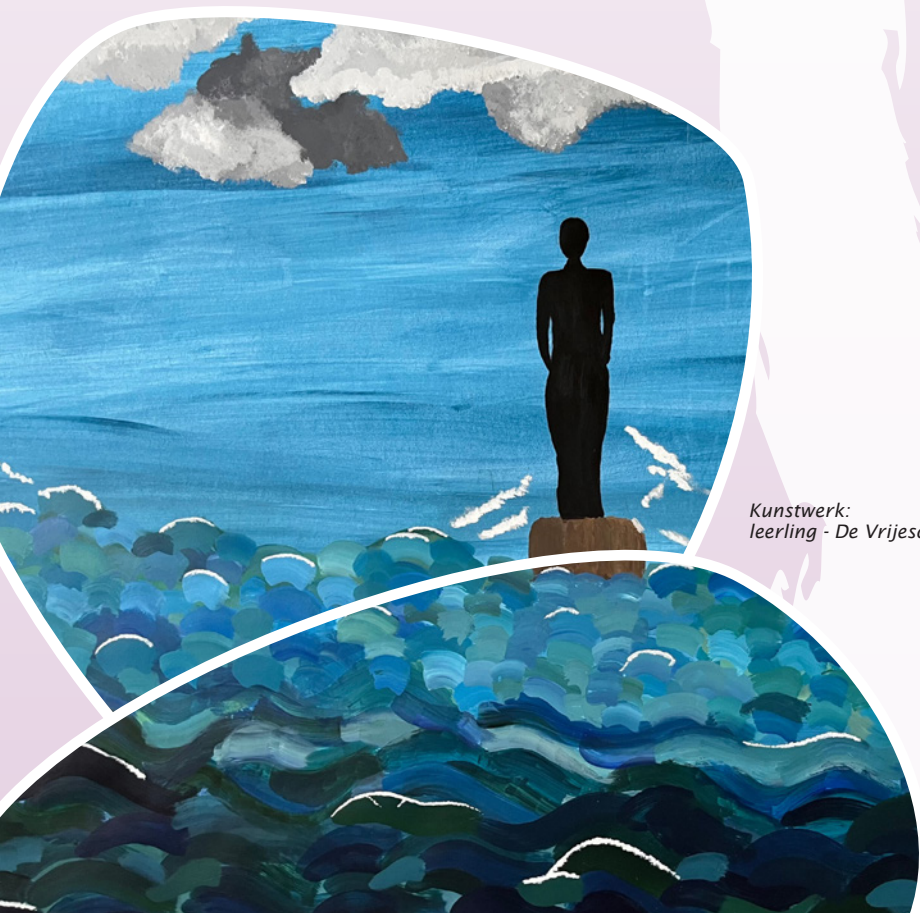
Kunstwerk: leerling - De Vrijeschool Den Haag