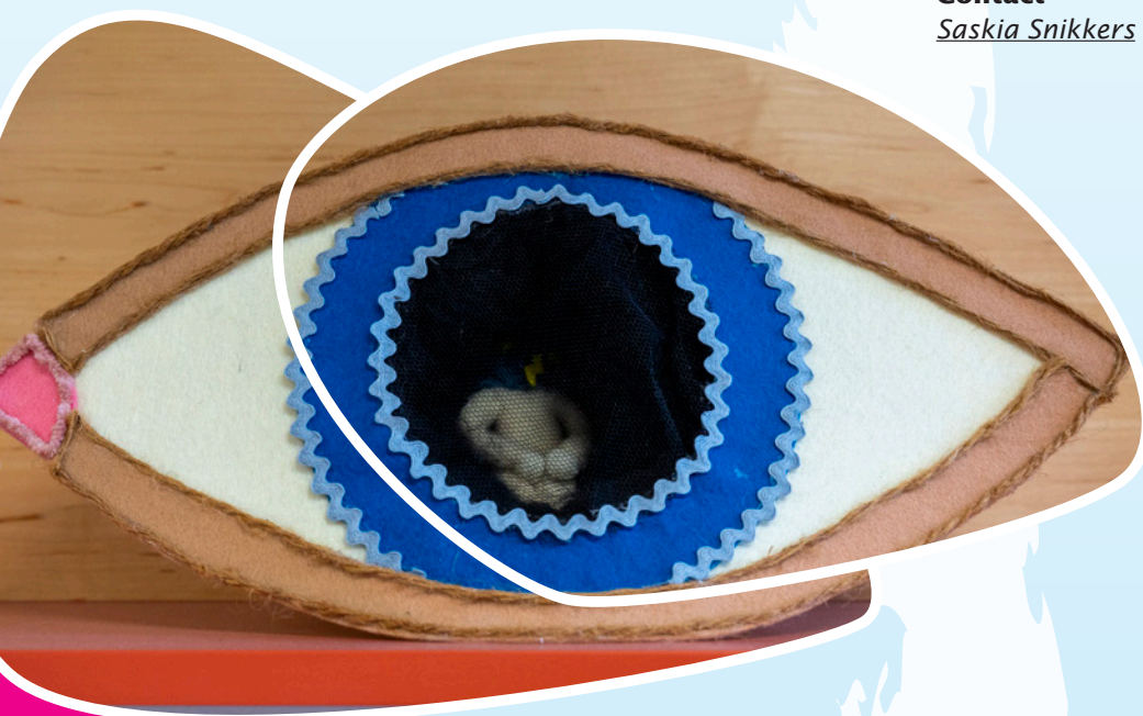
Kunstwerk: leerling - Marecollege