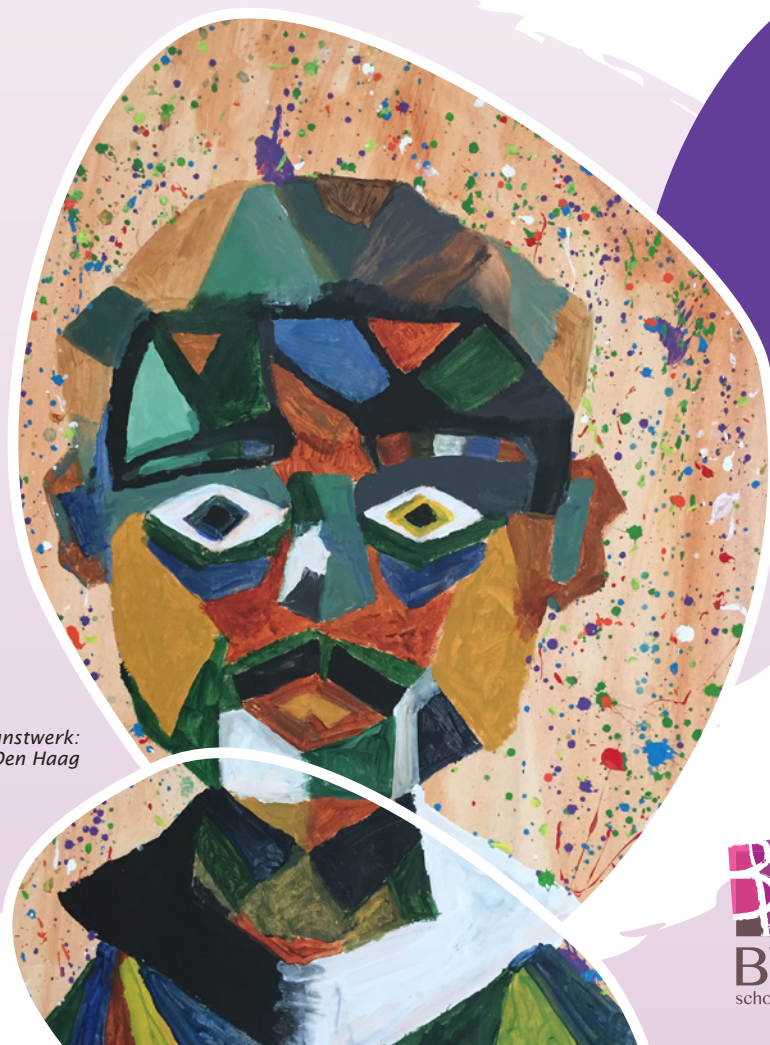
Kunstwerk: leerling - De Vrijeschool Den Haag