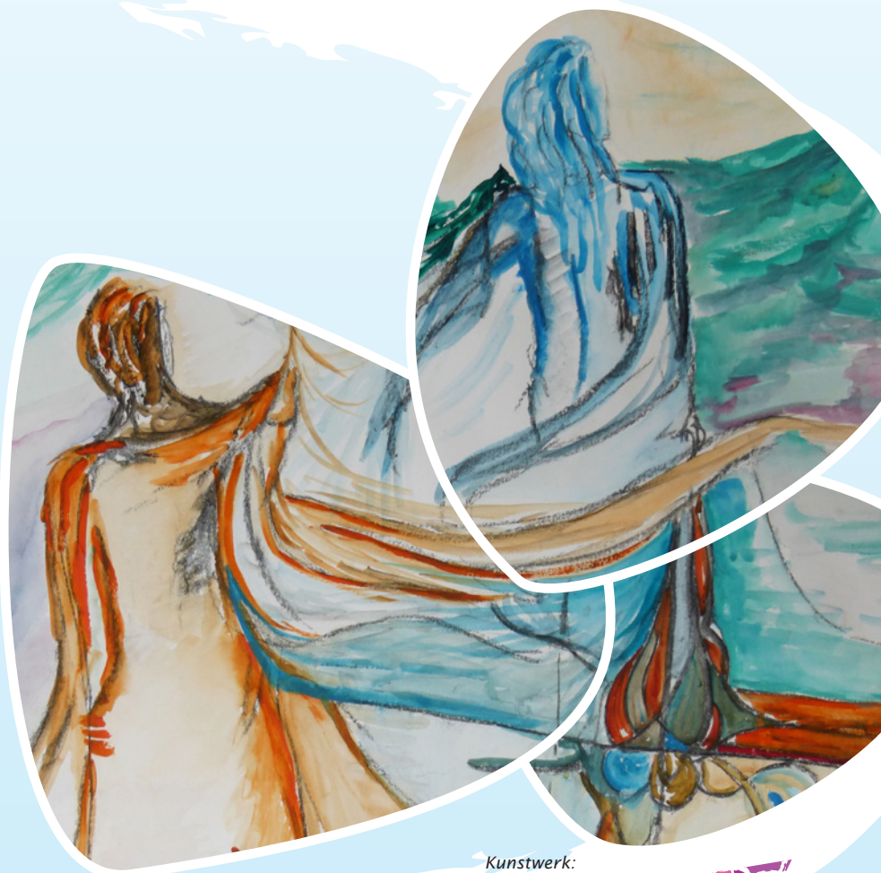
Kunstwerk: leerling - De Vrije School Den Haag